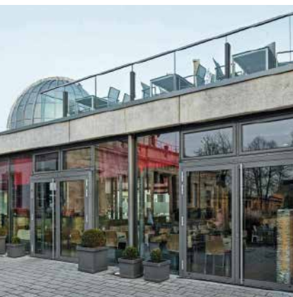
Алюминиевая дверная система Schüco ADS 75 HD.HI Schüco Aluminium door system ADS 75 HD.HI

Алюминиевая дверная система Aluminium Door System