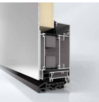
Дверная система Schüco ADS 75 HD.HI Schüco door system ADS 75 HD.HI