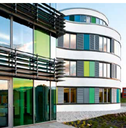
Алюминиевая дверная система Schüco ADS 70.HI Schüco Aluminium door system ADS 70.HI

Алюминиевая дверная система Aluminium Door System