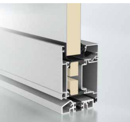
Schüco Дверь ADS 70.HI Schüco door ADS 70.HI